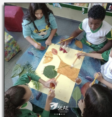
Alunos em oficina