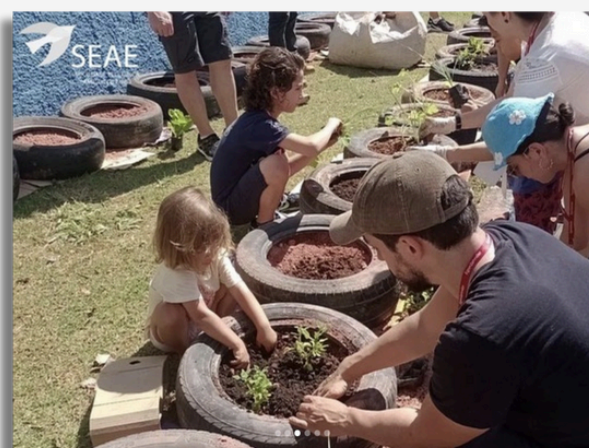
Famílias no projeto Semeando o Futuro.