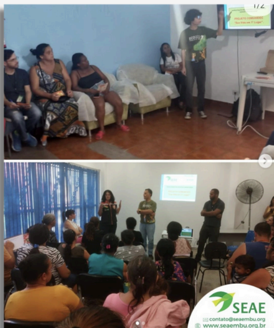
Oficinas Comunidec nos bairros Dom José e Jardim do Colégio

Através de treinamentos e atividades práticas , a comunidade aprendeu a identificar riscos, como agir em situações de emergência e a importância da organização comunitária para enfrentar desafios comuns. A parceria com a Defesa Civil foi fundamental para garantir a qualidade das informações e a disseminação das ações.