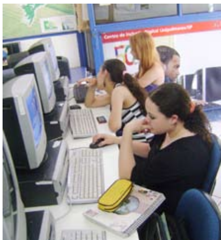
Produção de textos, TCC, pesquisas, revisão com o apoio do CID Ambiental