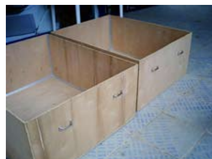
Gestão de Áreas Verdes dá suporte aos projetos: bio-construção, abrigo para lixeiras e caixas para transporte da maquete