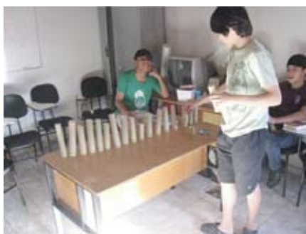
Produção de Copos de Bambu uma oportunidade de ecomercado