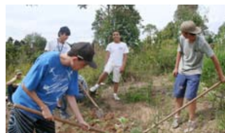
Jovens aprendem a manejar a terra com a equipe do Colhendo Sustentabilidade na Oficina de Promafs