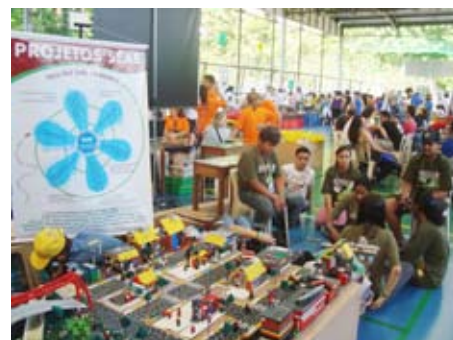
Animação da Equipe do CID Ambiental e exposição da maquete

A montagem e apresentação de uma maquete fez parte do Encontro. A maquete dos jovens do CID Ambiental representou uma comunidade onde todas as habitações utilizavam captação de energia solar para transformá-la em energia elétrica (painel fotovoltaico). Outra ideia apresentada foi o ponto de ônibus que com o movimento das pessoas também gera energia para a cidade. É um mecanismo que com o movimento aciona dínamos, gerando energia elétrica. Esse sistema já está em uso em alguns países. Os veículos que trafegam por essa cidade também eram movidos por energia solar. Para demonstrar o princípio, os jovens construíram um robô programado para se movimentar somente quando detectava a luz de uma lanterna.