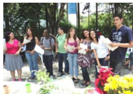
Festa de Formatura no CID Ambiental: entrega de certificados, exposição de trabalhos e coral da turma de inglês