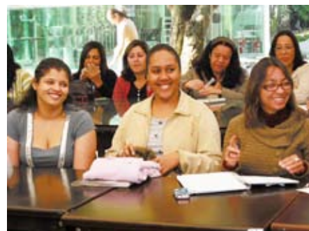
União e partilha de saberes nas atividades coletivas