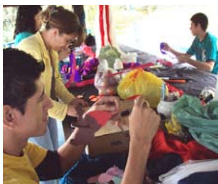
Halloween: preparação da decoração feita pelos educandos