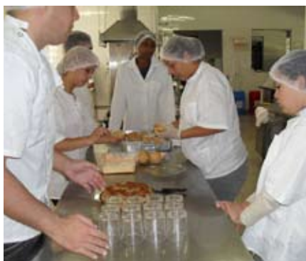
Oficinas de Gastronomia Artesanal e Eventos Gastronômicos dão ênfase à produção sustentável e de aproveitamento de alimentos, além de ensinar na prática técnicas de atendimento ao cliente