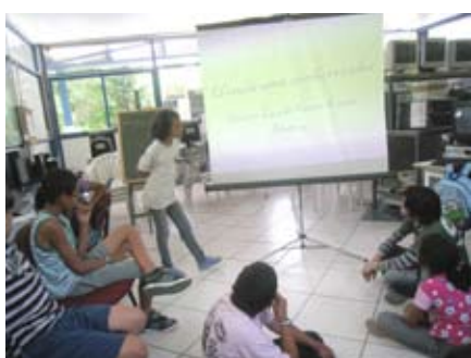
Criando História desenvolve a criatividade e o gosto pela leitura através do uso da informática