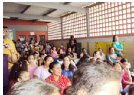
Encenação da peça Floresta Encantada na Escola Mikio Umeda mobiliza a comunidade. O foco da peça foi a coleta seletiva