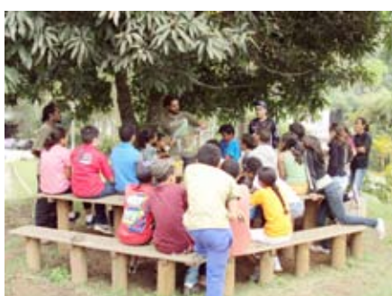
Doze escolas participaram das atividades dos Roteiros Temáticos. As temáticas mais procuradas foram a Água e o Lixo