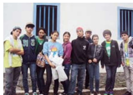
Grupo visita o centro de Embu para conhecer atrativos culturais