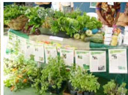
Elo da Terra aprimora atividades. Durante o trimestre foram realizadas 15 feiras