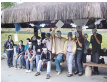
Halloween Pererê: diversão garantida