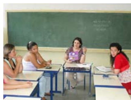
Atendimento personalizado aos educadores traz resultados positivos na sala de aula