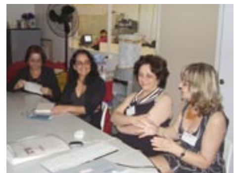
HIPÓTESES DE ESCRITA MUNICÍPIO DE EMBU